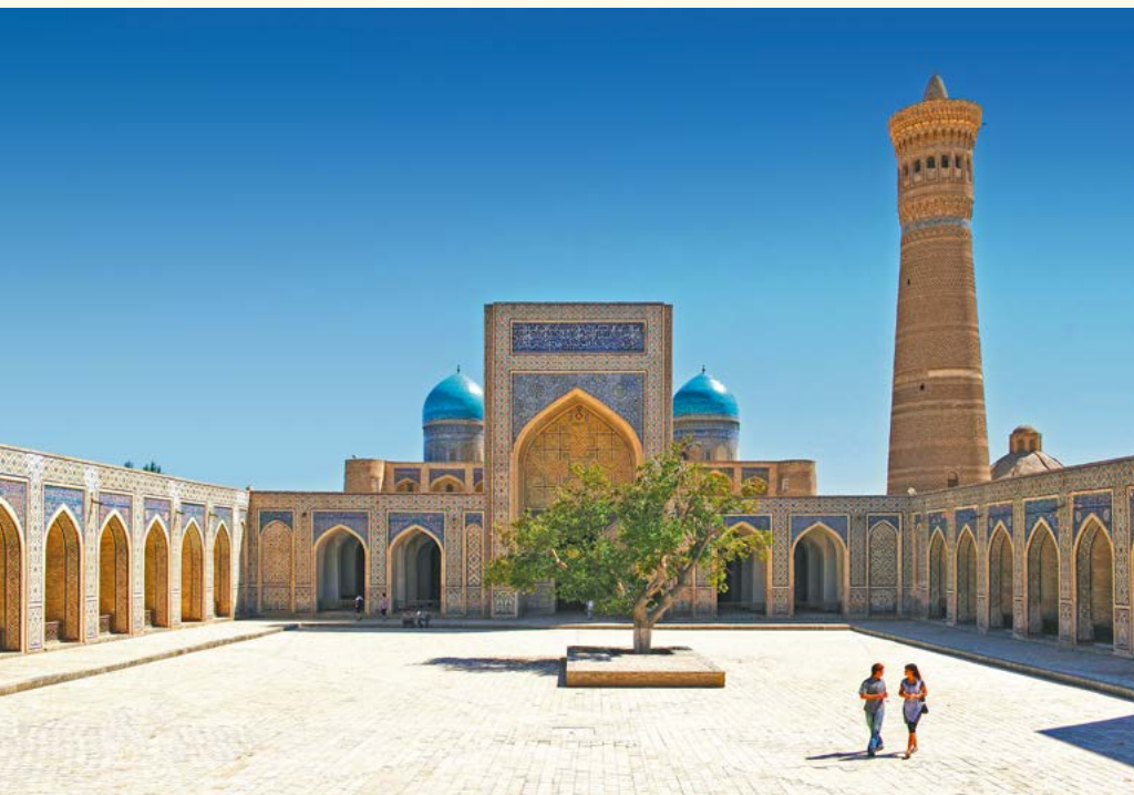
Im Poi-Kalon Komplex in Bukhara

Reiseverlauf: Urgentsch - Chiwa - Buchara - Samarkand - Taschkent Zusatzausflug: Shahrissabz