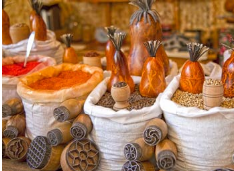
Gewürze auf dem Markt

Anschließend steht ein Besuch des Pachlavan Machmud Komplexes, der das Kuppelmausoleum des Dichters und Arztes Pachlavan Machmud einschließt, auf dem Programm. Zum Abschluss geht es weiter zum Tach-Hauli-Palast aus der ersten Hälfte des 19. Jahrhunderts mit seiner eleganten Architektur. Am Abend Galadinner in der Sommerresidenz Tosa Bog mit choresmischer Folklore.