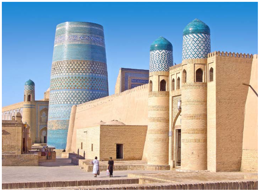
Kalta Minor in Chiwa

Die Handelsstadt an der Seidenstraße hat noch viel mehr zu bieten! Mitten im Zentrum lockt das prächtige Gebäudeensemble Poi Kalon aus dem 12. bis 16. Jahrhundert. Mit 46 Metern Höhe ist das Kalon-Minarett als Wahrzeichen der Stadt weithin zu sehen, auch die Kalon-Moschee und zwei Koranschulen gehören zum berühmten Komplex. Vorbei an