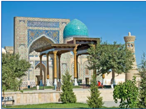
Medrese Ulugh Beg